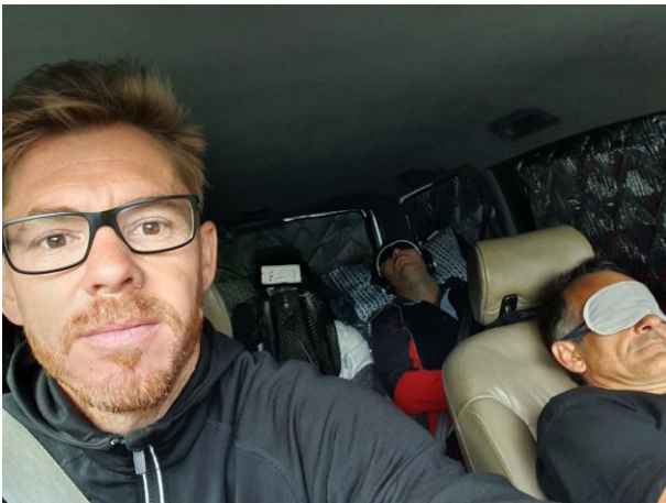
Les enfants sont sages et le convoi s'étire...