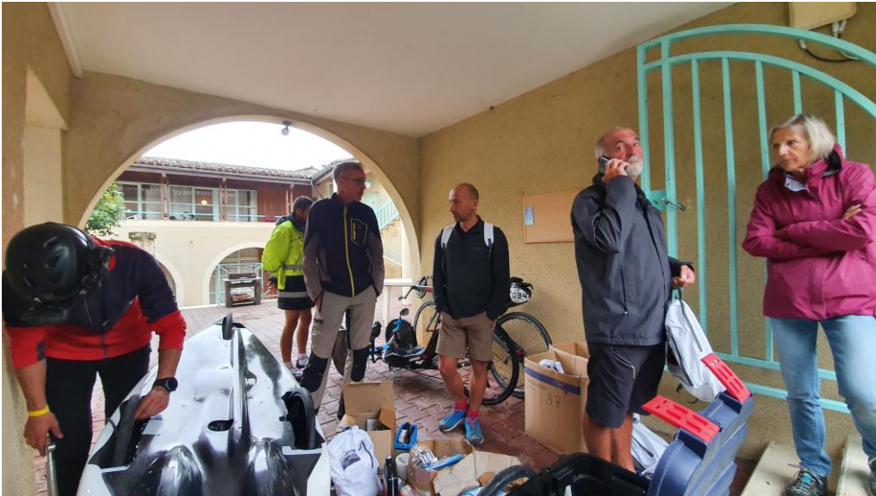
Le rituel, le bordel !

Après un samedi soir à jouer au babyfoot et à manger un canard de plus, le dimanche arrive (trop) vite et trop tôt !